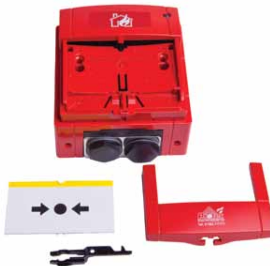
Puszka do montażu natynkowego MCP BOX