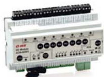
od strony 62