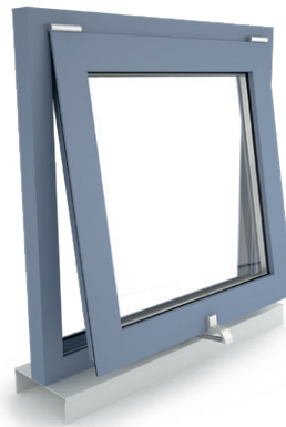
+ Okno odchylne, otwierane do wewnątrz