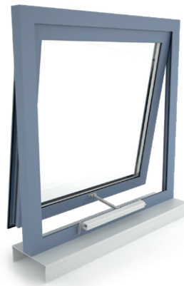
+ Okno odchylne, otwierane na zewnątrz