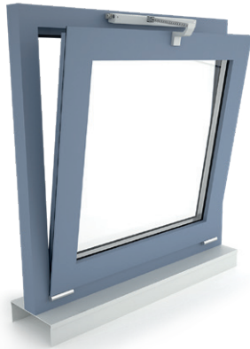
+ Okno uchylne, otwierane do wewnątrz