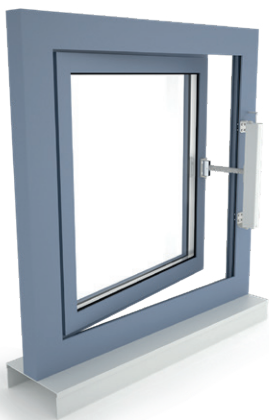
+ Okno rozwierne, otwierane na zewnątrz