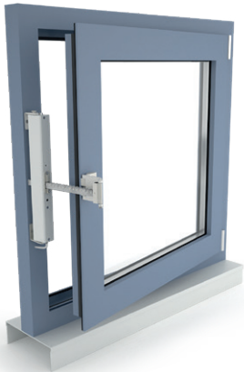
+ Okno rozwierne, otwierane do wewnątrz