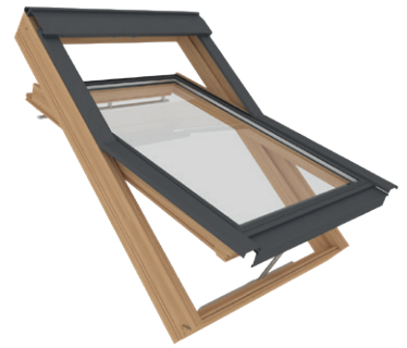
+ Okno połaciowe, otwierane od dołu